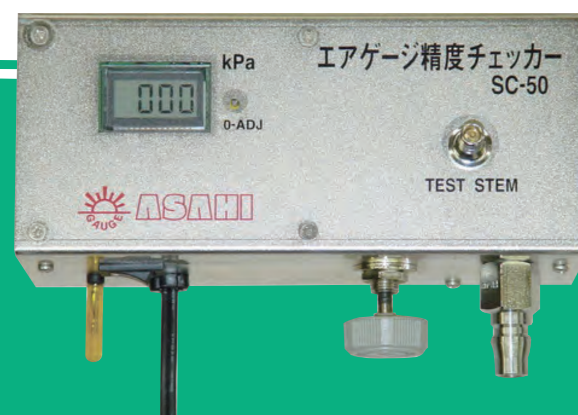
エアゲージ精度チェッカー

ご希望のお客様は、安全自動車にて精度チェックを行っておりますのでお申し付けください。