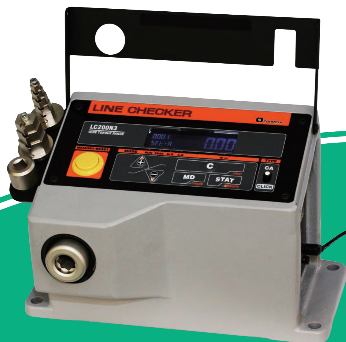
トルクレンチ精度チェッカー