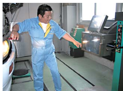
“画像処理方式手動ヘッドライトテスター”は、抜群の精度で瞬時に測定を完了!

で、作業の効率化につながっています。また、“画像処理方式手動ヘッドライトテスター”はすれ違い灯も瞬時に測定でき、精度も高いので非常に使いやすいです」と検査員の方から高い評価をいただきました。