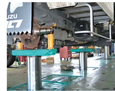
上昇時もフラットな床面 安全面に配慮した作業が可能

また、大型車向きの工場にもかかわらず、そこには乗用車向きの“アルネオリフト”の姿も。設置した理由を長谷川さんにお聞きしたところ「かつては、いすゞも乗用車を生産・販売していましたから、今も乗り続けてくださっているお客様の来店にそなえています」とのこと。いつまでもお客様のフォローを忘れない。同社のもごころは、装いも新たな工場の隅々まで行き渡っていました。