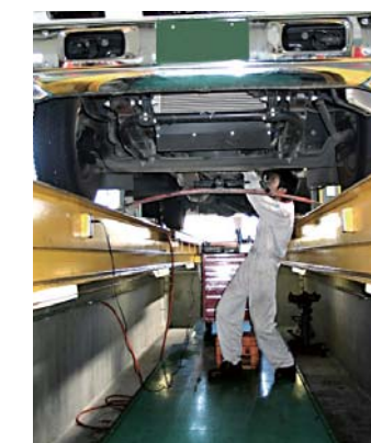
多目的に使える2分割“フロアリフト” 自由な高さ設定でメカニックの負担を軽減