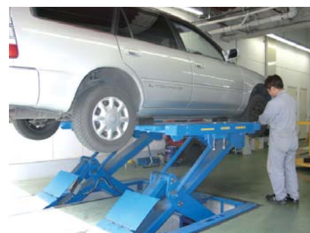
様々な車種に対応した“ラムダリフト”で整備はバッチリ!

3階建ての大型工場の1階にはショールームと大型車整備ができるよう天井を高くした一般整備及び検査ライン(1ラインで軽から大型車まで共用)を備え、2階では板金塗装を行い、3階は収容数50台以上の駐車場になっています。1階にはアライメントテスター“3DビジュアルライナーARAGO”が設置され、小型整備リフトの“マルチリフト”と“ラムダリフト”が工場エントランス付近にセッティングされています。リフトは足回り整備、クイック整備、オイル交換など整備内容によって効率的に使い分けられています。アライメントテスターは足回りのダメージ測定や修復後の測定及び調整、偏磨耗タイヤ装着車の