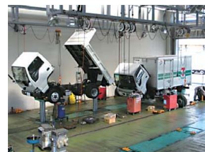
2台を1ストールで整備できる4柱式“ツインパワー”

整備工場のレイアウトは9ストール+洗車場+検査ライン。ピットにはキャタピラターン方式“ツインパワーリフト”の4柱式、“フロアリフト”などがビルトインされています。ツインパワーリフトの4柱タイプを選んだ