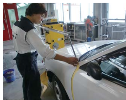
3次元計測器“タッチ”で損傷箇所を正確にチェック

2階の板金工場では、イタリア・スパネーゼ社のフレーム修正機“セリエ100”とマルチアライメント3次元計測器“タッチ”が活用されています。“タッチ”は車体のあらゆるダメージを数値化する計測診断システムです。目視では分からないボディーの歪みやホイールアライメントのズレを数値で表示し、要修理箇所の測定・分析を行ってくれるこのシステムは、今やボディーショップの必須ツールと言われています。「アライメントは入庫時に測定しておき、修復後に許容範囲に数値が入っているか再び測定します。結果を数値でプリントアウトし、お客様や損保会社に対して提示できるため説得力のある診断機であると思います。車種やダメージの内容によってアライメントテスターと使い分けています。もちろん近隣の板金工場から入庫される車にも“タッチ”が活躍していますよ!」地域ナンバーワンを目指す同社では、高い志と技術力をもって、良質なサービスを提供していました。