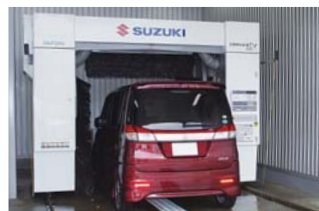
同社初の導入となる節水仕様の 「カービスEXeco」