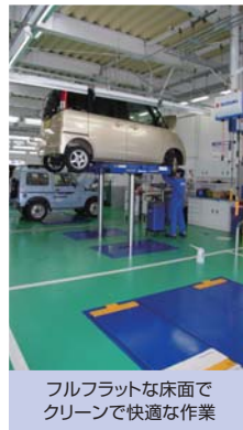
フルフラットな床面で クリーンで快適な作業

また、リフトも作業効率と快適さを考慮して使い分けています。「マルチリフト」は主に1ヶ月・6ヶ月点検とオイル交換に使い、「アルネオリフト」はエンジンやミッションの脱着などの重整備に使っています。そして、乗り入れや作業利便性などを考えてプレート&アーム式とスイングアーム式を使い分けています。さらに、リフトアップして車体を洗浄するときには耐水仕様のリフトを使っています。どのリフトも、共通している導入の決め手はフルフラットであることでした(下出さん)。