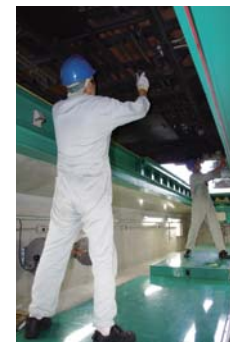
使い方が自在の「2分割フロアリフト」で高効率整備を実現