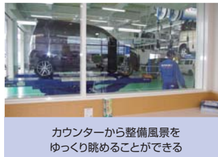
カウンターから整備風景を ゆっくり眺めることができる

明るく開放的なショールームには、隣接するサービス工場内が一望できるスペースを確保。入庫促進策のメンテナンスパックに含まれるオイル点検など、お客様は自分の車両がどのように整備されているのか、ガラス越しに眺めることができます。