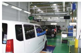
「ラインマスター」の導入で、今まで 2人で行っていた作業が1人でも可能に

また、リフトも作業効率と快適さを考慮して使い分けています。「マルチリフト」は主に1ヶ月・6ヶ月点検とオイル交換に使い、「アルネオリフト」はエンジンやミッションの脱着などの重整備に使っています。そして、乗り入れや作業利便性などを考えてプレート&アーム式とスイングアーム式を使い分けています。さらに、リフトアップして車体を洗浄するときには耐水仕様のリフトを使っています。どのリフトも、共通している導入の決め手はフルフラットであることでした(下出さん)。