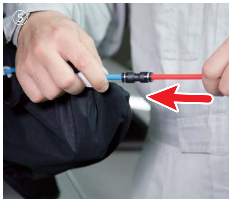
⑤ エアホースをセットします。