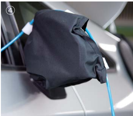
④ ドアミラーカバーを取り付けます。