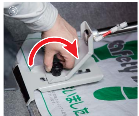
③ つまみノブを締め、ツールベースを固定します。