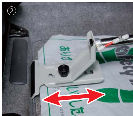
② ツールベースの長さを調整し、車両クロスメンバー部に当てます。