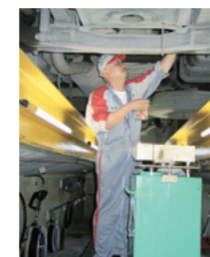
高さの調整ができ、メカニックのベスト ポジションで作業ができるフロアリフト

同社では今回、あらゆる整備に最適化するフロアリフトも設置しました。「これからは点検の時代になると考え、そのための作業効率アップとメカニックの負担軽減を重視して設置に踏み切りました。最近のクルマは、メンテナンスの差がエンジンの寿命差に直結します。例えば寿命をのばすためのオイル交換もさらに提案していきますので、フロアリフトは今後かなり重宝すると思います。また、ミッションやクラッチの整備と交換にはフロアリフトが最適です。そのためにフロアリフトの中にミッションリフトを収納しました。その他整備に使う機器をフロアリフトの中に収納し、整備工場内をスッキリ整理させています。また通常フロアリフトの長さは10mですが、今回は12mにしました。同時に2台の作業をできるようにという考えからです。わずか2mの差ですが、この差は実は大きいのです」と(佐藤さん)。