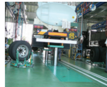
4軸のエアサス車には4柱タイプの ツインパワーリフトが最適!

沼津営業所のサービスピットは8ストール+検査ライン+洗車場です。そのうち2ストールは沼津工場の大きな特徴でもある、通り抜けができるストールです。このストールは前後で2台の整備ができるので、同時に整備をしても前後どちらからも出入りができます。また、そのうち1台