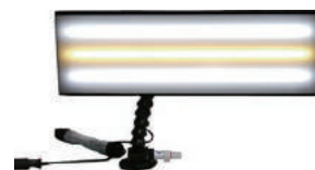
型番 580006 デント用 LEDライト (スタンダード) 170×470mm