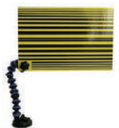
型番 580009 デント用ラインボード 210×290mm