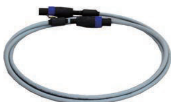
型番 580001 ロングサイズケーブル 約 3m