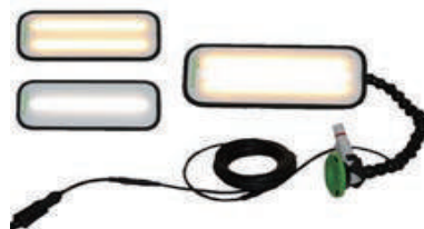
型番 580005 デント用 コンパクトLEDライト (高性能) 135×330mm