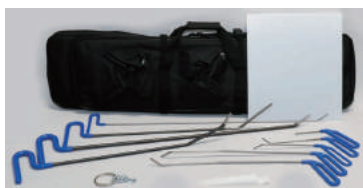
型番 580015 PDRツールセット(ケース付き)