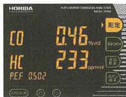
測定 (オレンジ点灯)