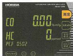
スタンバイ (グリーン点灯)