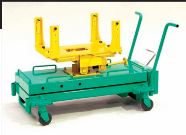
コンパクトに収納