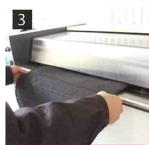
3 裏返して挿入します