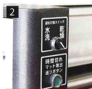
2 水洗いモードに切換え