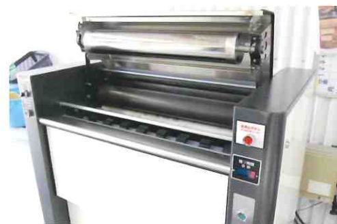
開閉式上部カバーによりメンテナンス性が抜群

マットを裏返して入れるだけの簡単操作で使用できます。また巻き込みトラブルを最小限に抑えた設計と、ドライバーを必要としない抜群のメンテナンス性が自慢です。