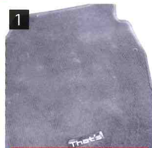
1 汚れた自動車マット