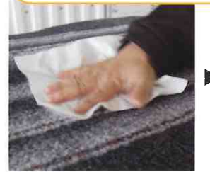
毛足の長いフロアマットも、ほぼ水分がありません