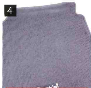
4 洗浄と乾燥が完了！