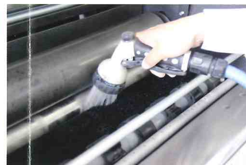
機械の中は水洗いOK！らくらくメンテナンス