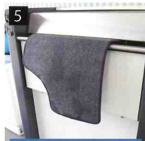
5 マットを挿入します