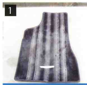
1 長年洗っていないマット