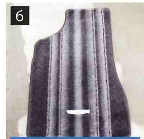
6 キレイに仕上がります