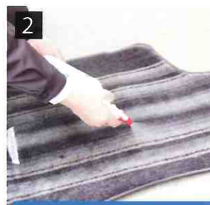
2 洗剤を吹き付けて