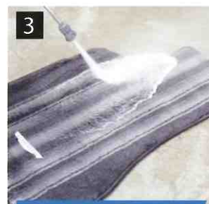
3 高圧洗浄機で洗います