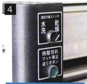
4 乾燥モードに切換えて