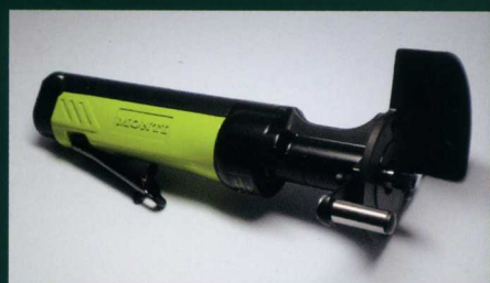
■ニューマチックドライブユニット SDB-002