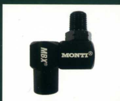
■回転型コネクター ZU-073