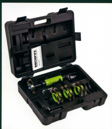
■プラスチックケース ZU-051