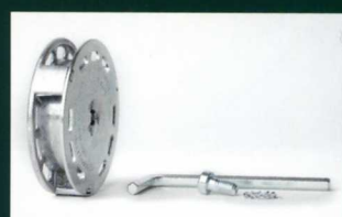
■アダプターシステム AS-012(AD-S) (安全性のある高品質ダイカストアルミニウム製)