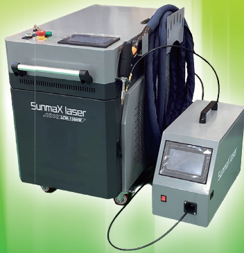
溶接・切断・錆取り可能の ファイバー レーザー溶接機