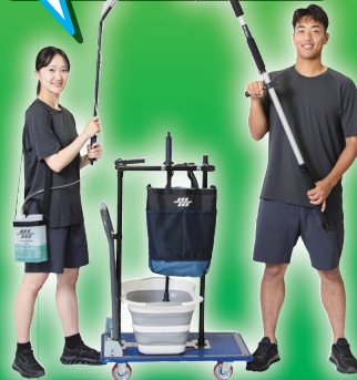
トラック専用 手洗い洗車ツール WASHMAN FOR TRUCK