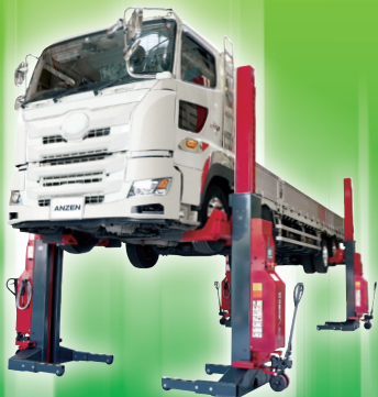
設置工事費不要な モバイル コラムリフト

リフト バッテリーテスター EV整備 省力化機器 電動工具 安全対策 暑さ対策 板金・溶接・塗装 洗車・洗浄