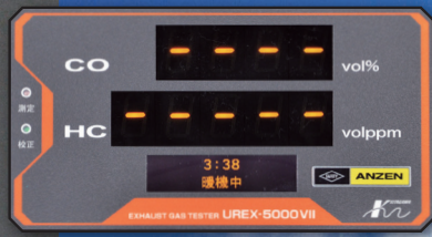
暖機時間カウント(4分)