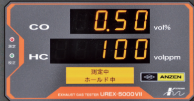
操作ナビゲーション